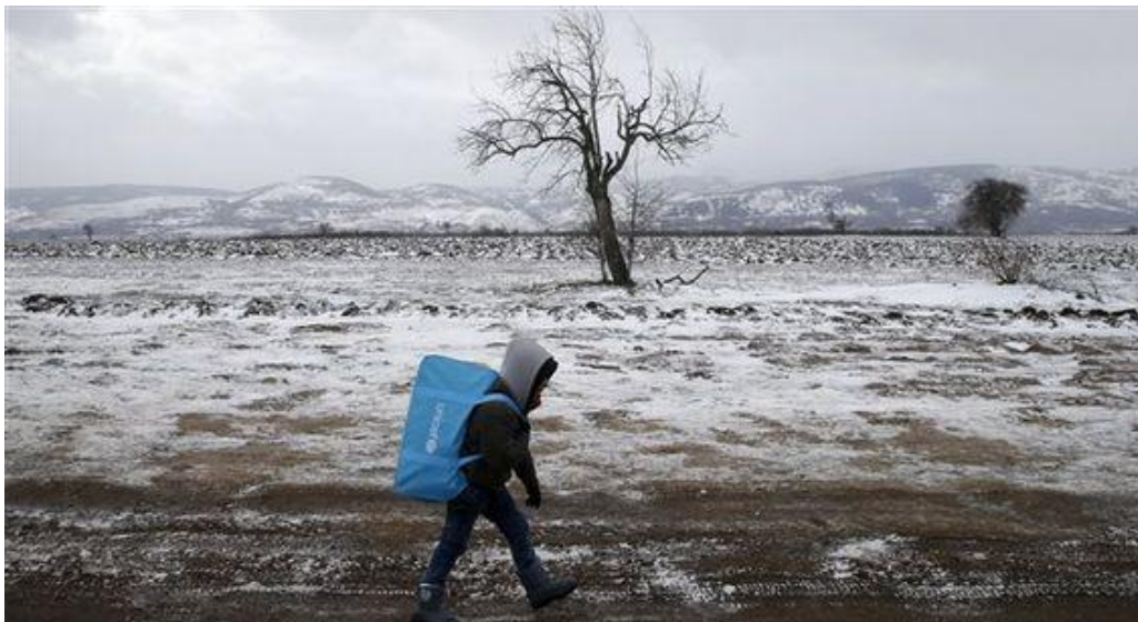
Jeune migrant traversant la Macédoine

Avant, y avait tout. Maintenant y a plus rien. Avant on jouait à tout. Tout le temps. Un deux trois soleil. Un deux trois soleil. Bougé !