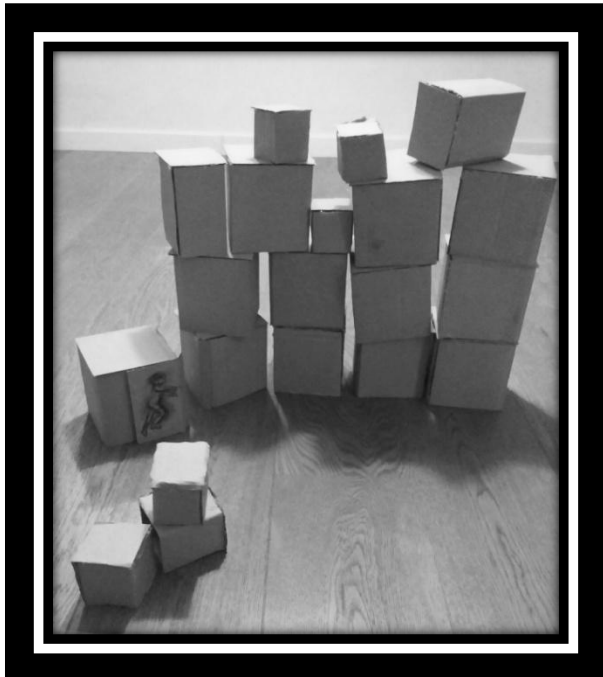
Esquisse pour Poussé ! 4#/ B.Vallet