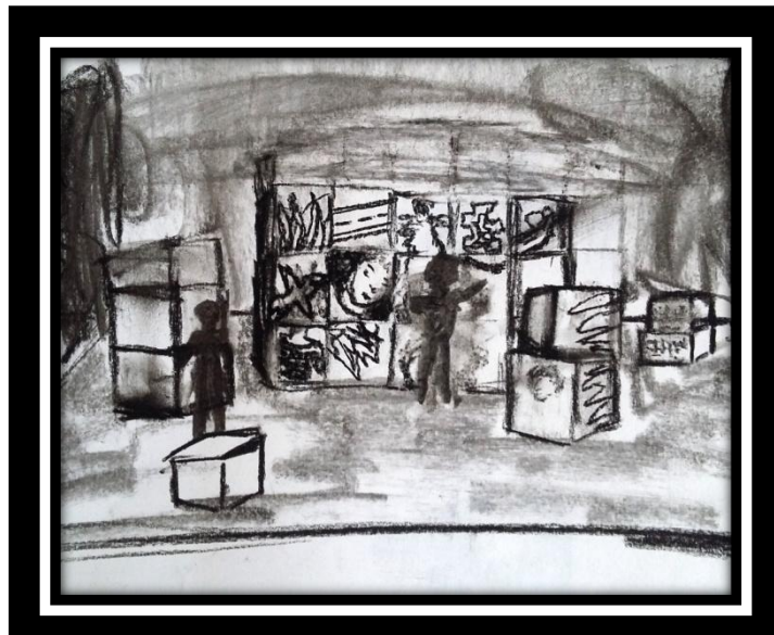
Esquisse pour Poussé ! 1# , B.Vallet