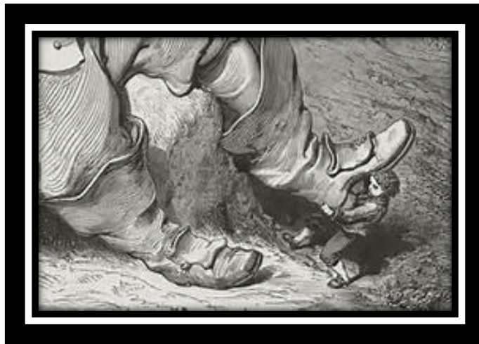
Le Petit Poucet, ill.de Gustave Doré

Au fil de nos discussions se tisse un parallèle entre ces jeunes gens jetés sur les routes et la fratrie du « Petit Poucet » de Perrault. La réécriture de ce conte classique s'offre, féconde, pour penser le drame de ceux qui quittent tout avec l'espoir de se construire ailleurs un avenir meilleur et se heurtent, à l'arrivée, à la peur de ceux qui répugnent à les accueillir. Le personnage du Petit Poucet est en effet une figure de héros positif qui met en œuvre ses qualités d'adaptation pour faire face à l'adversité, transformer une situation angoissante en promesse pour le futur et sauver les siens.